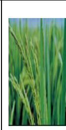
শীষ বের হওয়া