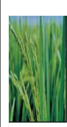
শীঘ্র বের হওয়া