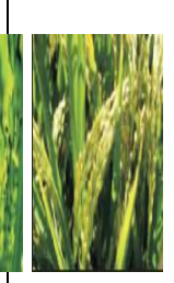
দানা জমাট বাধা