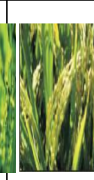
দানা জমাট বাধা