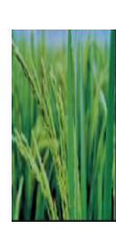
শীষ বের হওয়া