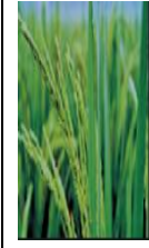
শীষ বের হওয়া