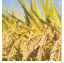
দানা জমাট বাধা